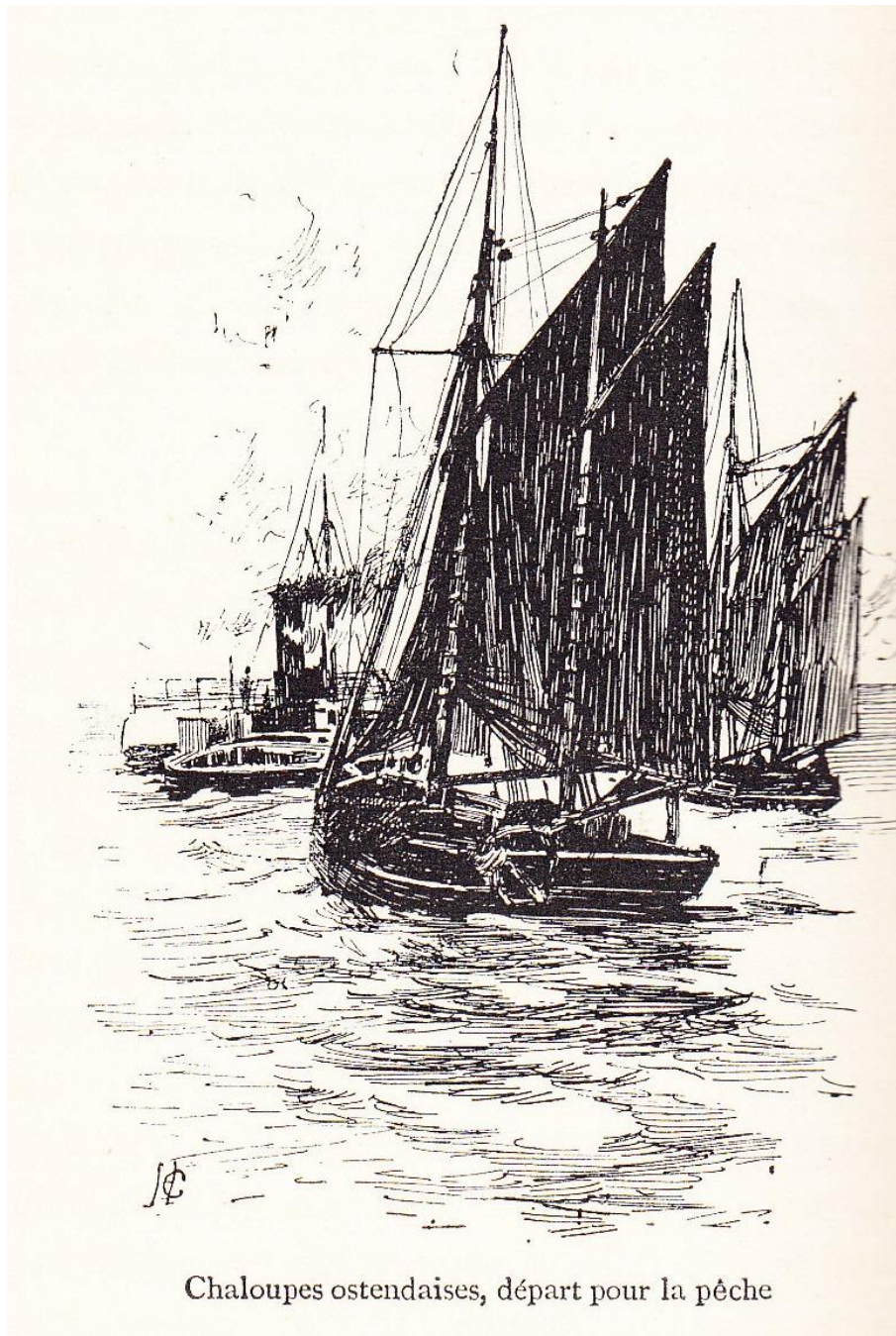
Chaloupes ostendaises, départ pour la pêche